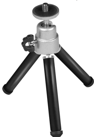
Mini trépied portable