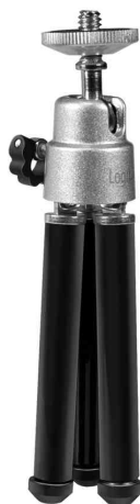
Mini trépied portable, replié