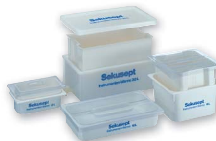
Das Sekusept® Wannen-System zur Instrumenten-Aufbereitung