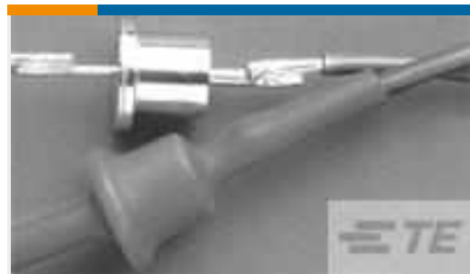
TE Teilenummer 8050654003 RNF-3000-1.5/0.5-3-SP