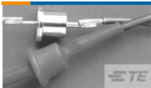
TE Teilenummer 5677764001 RNF-3000-1.5/0.5-6-SP