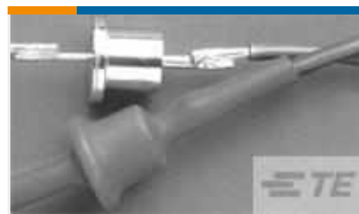
TE Teilenummer 6640214004 RNF-3000-1.5/0.5-5-SP