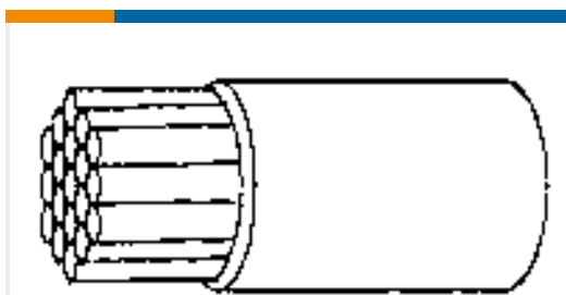
TE Teilenummer 1198043001 55M0414-26-9