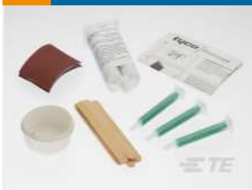
TE Teilenummer 657863-000 S1125-KIT-8