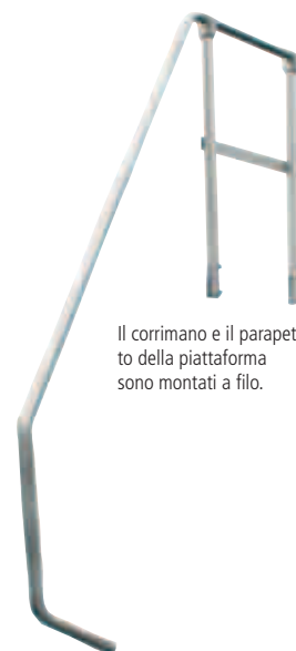
Il corrimano e il parapetto della piattaforma sono montati a filo.