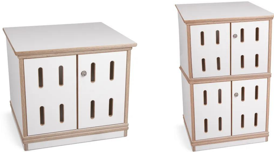
Abb. 1: Sport-Thieme Musikanlagenschrank Klein (links) und Groß (rechts)

Bewahren Sie die Anleitung gut auf. Für Fragen und Wünsche stehen wir Ihnen gerne zur Verfügung.