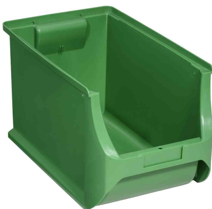
ProfiPlus Box 4H, vert