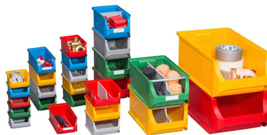
montre le choix de la taille et des couleurs