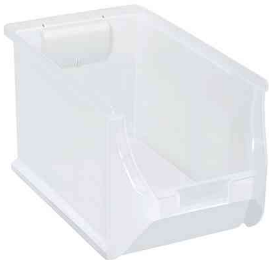
ProfiPlus Box 4H, transparent