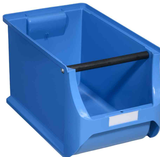
Visuel de référence : vue avec accessoires en option