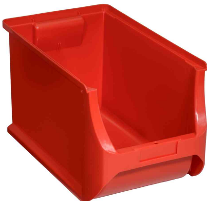
ProfiPlus Box 4H, rouge