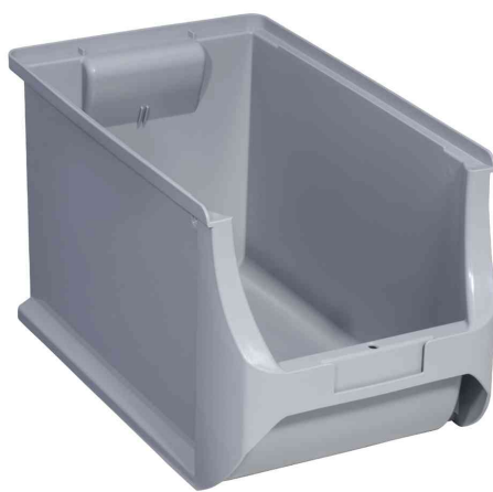
ProfiPlus Box 4H, gris