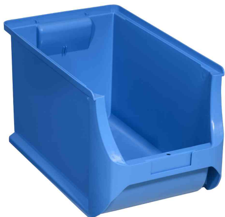
ProfiPlus Box 4H, bleu