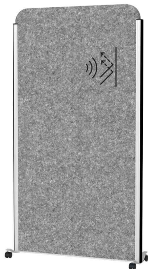
Stellwand MAULcocoon - Rahmen: silber, Rollen