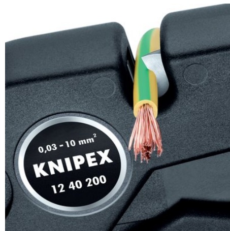
12 40 200: Arresto per regolazione della lunghezza