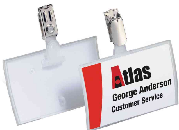
Porte-badge Click Fold, avec clip