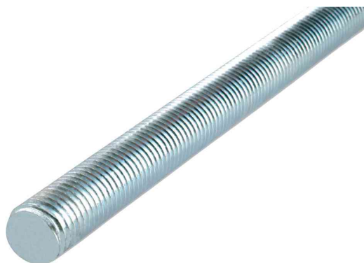
Visuel de référence: tige filetée