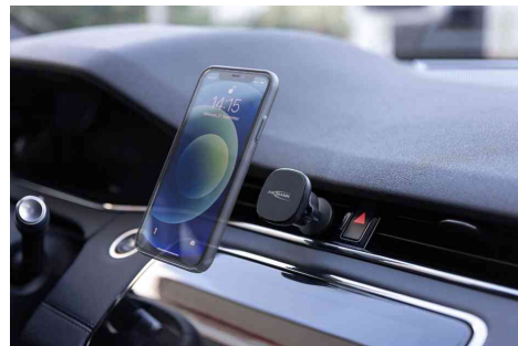
Visuel de référence : montre l'utilisation des petites plaques métalliques