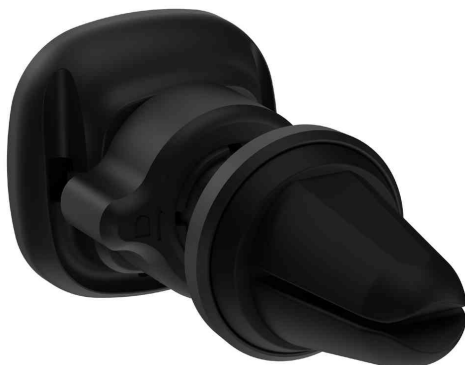
Support magnétique de smartphone pour voiture