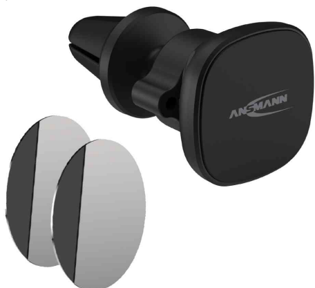
Support magnétique de smartphone pour voiture