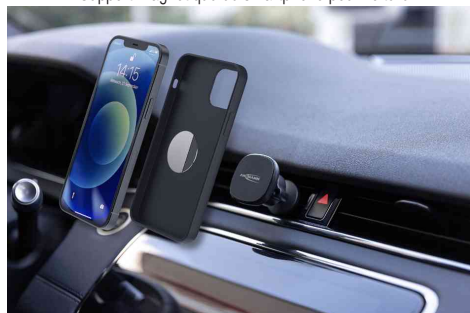
Visuel de référence : montre l'utilisation des petites plaques métalliques