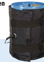
Wetterfester Heizmantel für 25 - 30-Liter-Fässer Bestell-Nr. 280-732-JY