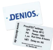
Konfigurierbare NFC-Karten für den digitalen NFC-Controller. Bestell-Nr. 280-738-JY