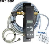
Digitaler NFC-Controller für größte Sicherheit Bestell-Nr. 280-737-JY