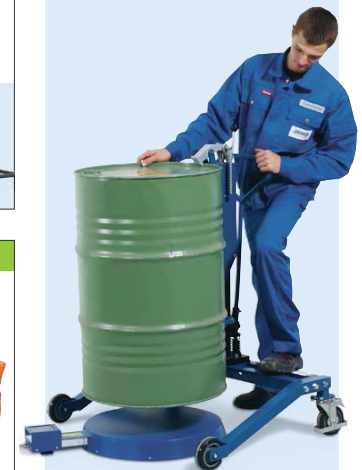
Fassheber Servo Eco zum leichten Transport des Fasses und Beschicken von z.B. Fassbodenheizern und Paletten. Bestell-Nr. 227-162-JY