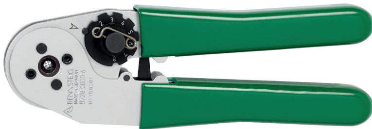
Art. No. 8728 0000 6