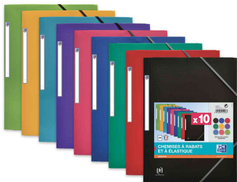
Chemises à élastiques Memphis, assorti 9 couleurs