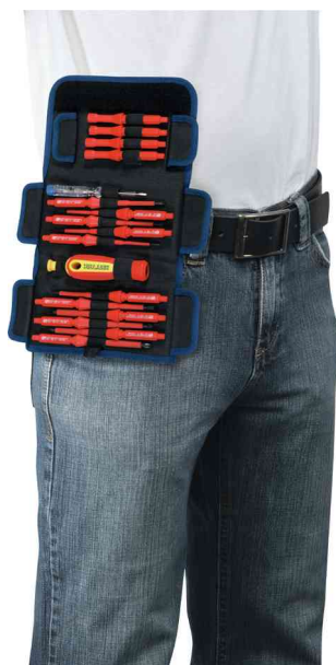
Visuel de référence: montre le produit en utilisation