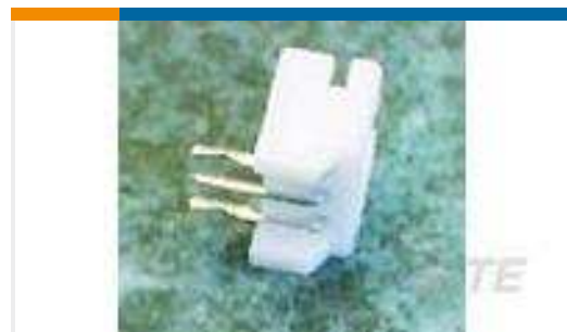
TE Teilnr.:1-440055-1 2.0MM,HDR,11POS,R/A