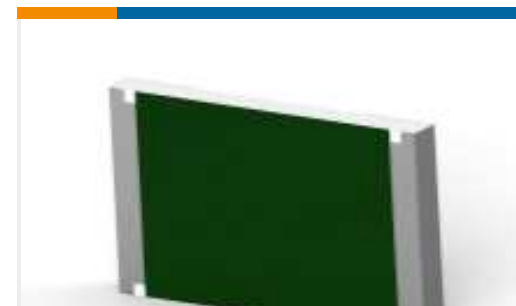
TE Teilnr.:8-2176407-8 3560 27R 5%