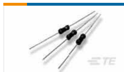
TE Teilnr.:4-1879350-2 RR01 5% 11R AMMO