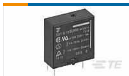
TE Teilnr.:8-1419125-5 SDT-S-106LMR,000