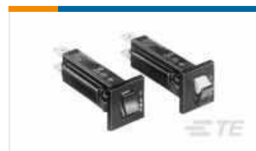
TE Teilnr.:1-1393250-7 W28-XQAT-15=W28