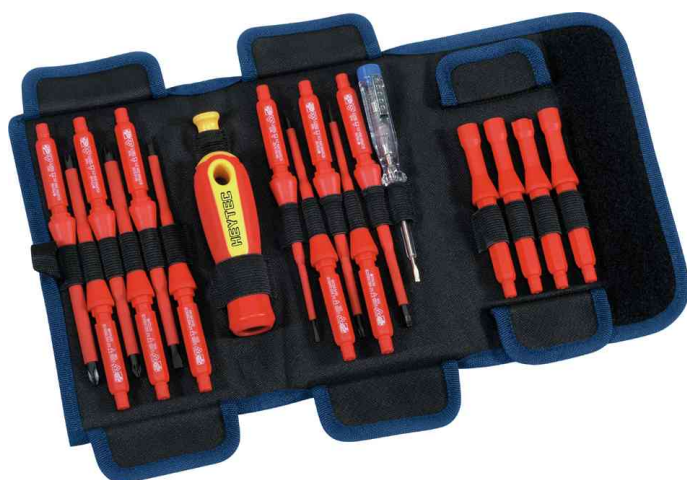
VDE Schraubendreher-Satz, 18-teilig