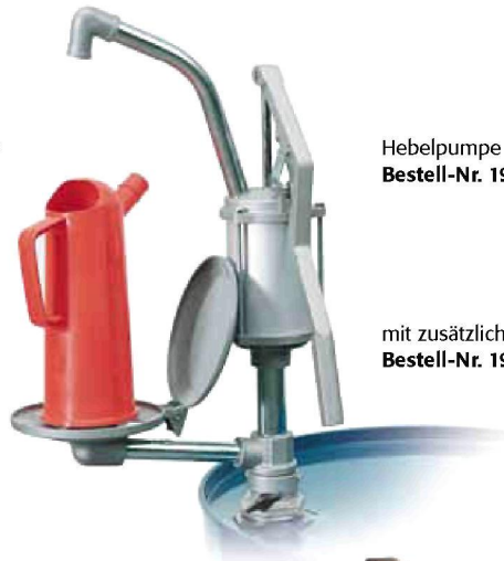
Hebelpumpe aus Aluminium (ohne Abbildung) Bestell-Nr. 19362