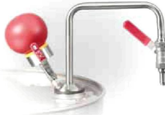
Lösemittelpumpe, Fußbetrieb Bestell-Nr. 16841