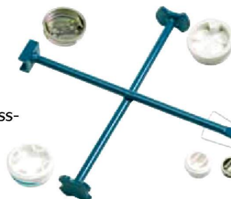
Kreuz-Fass-Schlüssel aus lackiertem Stahl Bestell-Nr. 19302