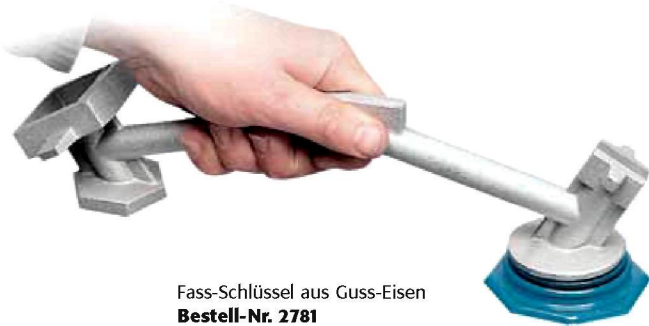
Fass-Schlüssel aus Guss-Eisen Bestell-Nr. 2781