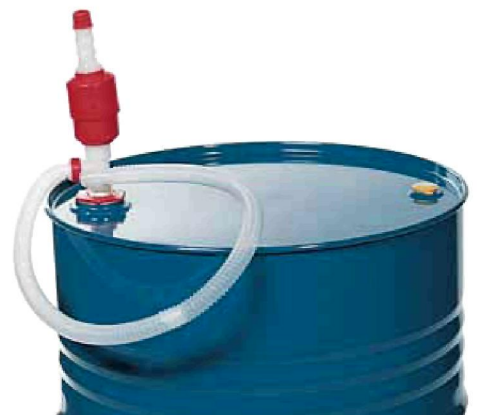
Handpumpe Bestell-Nr. 9703