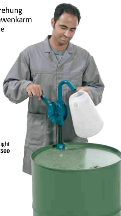
Kurbelrotationspumpe Alu-Light Bestell-Nr. 19300