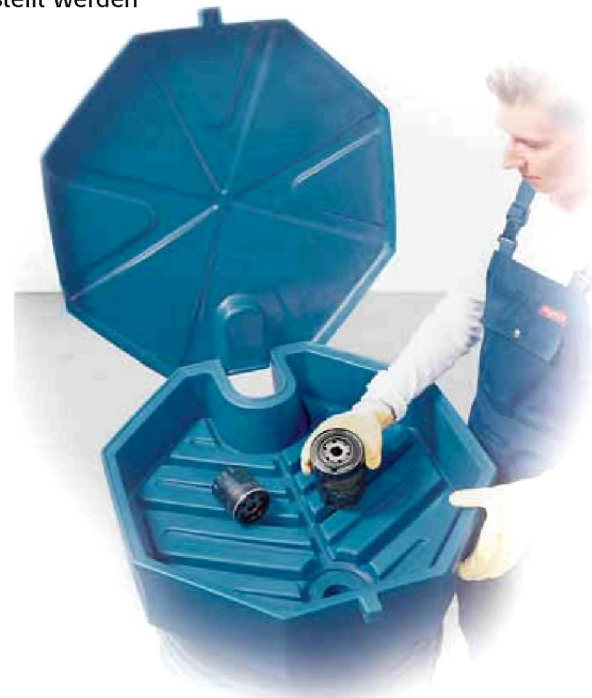
PE-Fasstrichter mit Deckel und Sieb, verschließbar Bestell-Nr. 11311