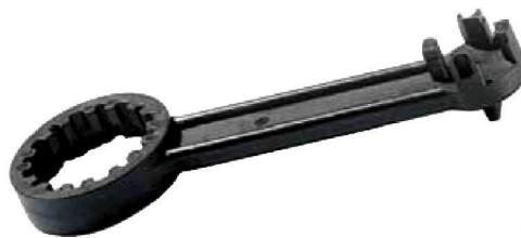
Fass-Schlüssel aus Kunststoff Bestell-Nr. 9701