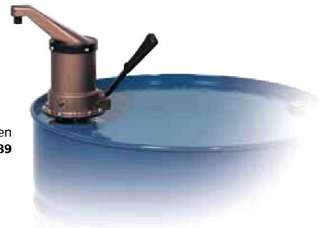
Hebelpumpe aus Polypropylen Bestell-Nr. 2789