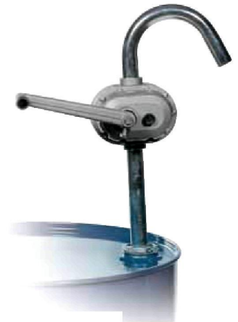
Kurbelrotationspumpe Alu Bestell-Nr. 14882