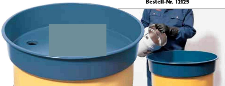
Stahl-Fasstrichter Bestell-Nr. 12125