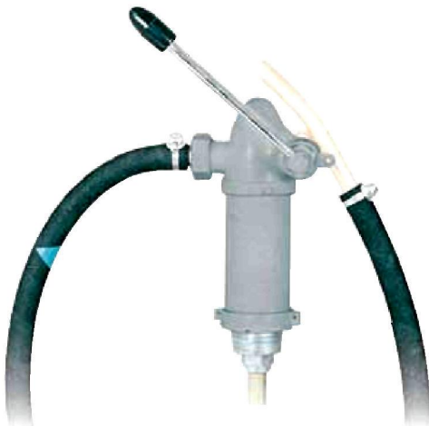
Fasspumpe aggressive Medien Bestell-Nr. 2742