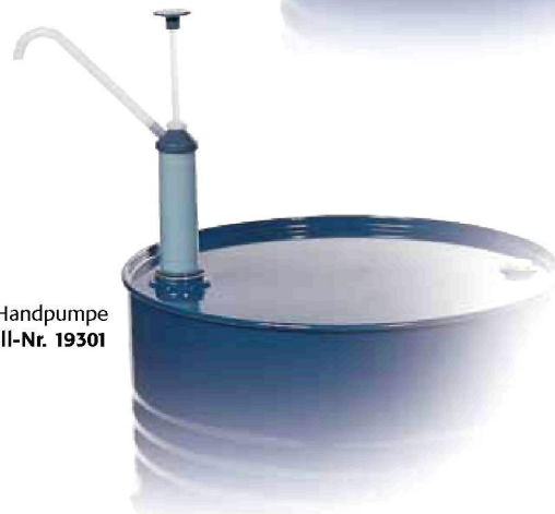
Handpumpe Bestell-Nr. 19301