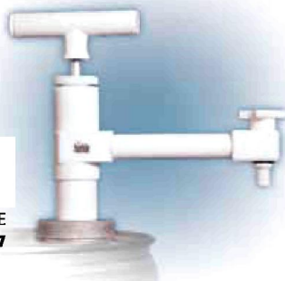
Fasspumpe PTFE Bestell-Nr. 16927