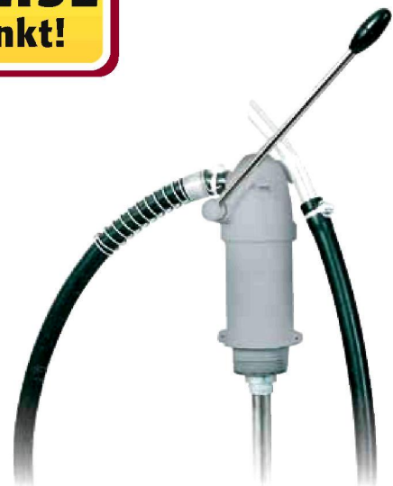
Fasspumpe Druckguss Bestell-Nr. 2741