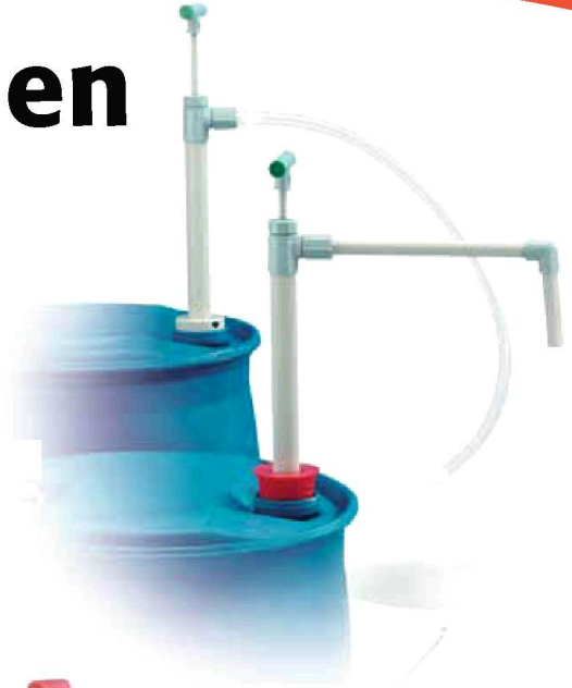
Fasspumpe PP gute chemische Beständigkeit