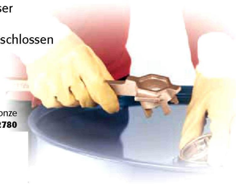
Fass-Schlüssel aus Bronze Bestell-Nr. 2780