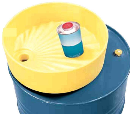
PE-Fasstrichter Bestell-Nr. 11874