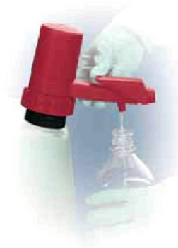
Behälterpumpe Bestell-Nr. 16840