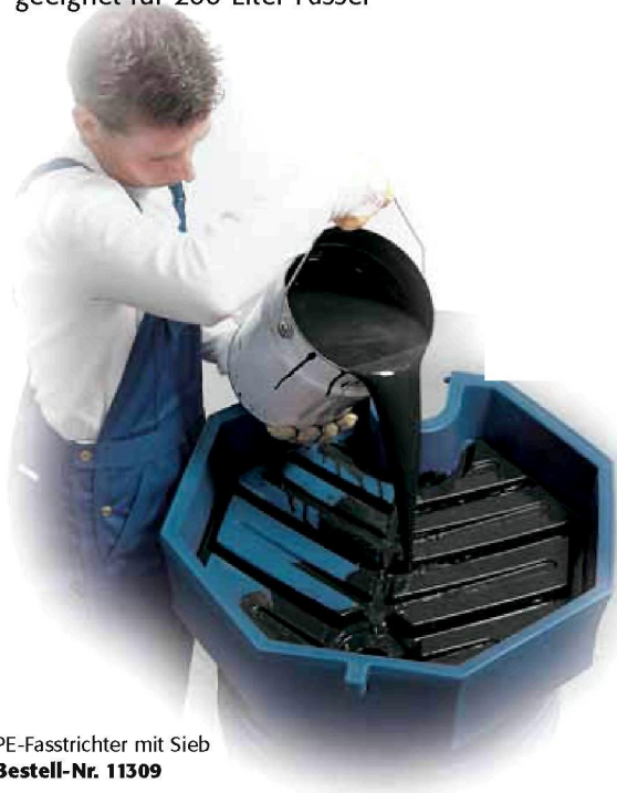
PE-Fasstrichter mit Sieb Bestell-Nr. 11309