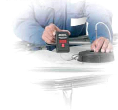
Elektronischer Peilstab mit Anzeige

Voreinstellung Heizöl: für Heizöl, Diesel, Flüssigkeiten von 790-900 kg/m 3 Dichte Bestell-Nr. 19350