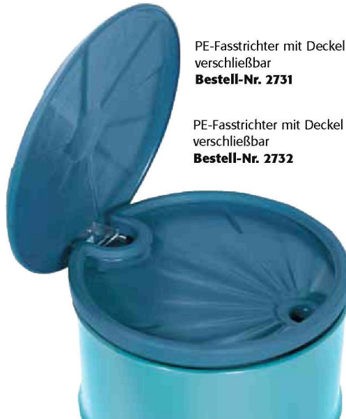
PE-Fasstrichter mit Deckel und Sieb, verschließbar Bestell-Nr. 2732