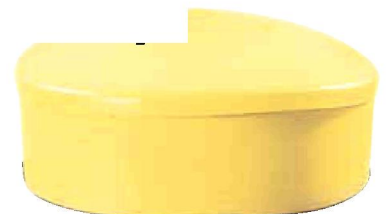
Deckel für Fasstrichter Schützt den Fassinhalt vor Verunreinigungen Bestell-Nr. 11875