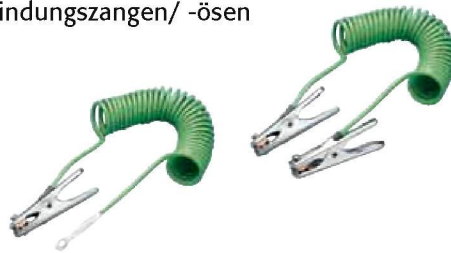
Spiralerdungskabel mit 1 Erdungszange und 1 Öse