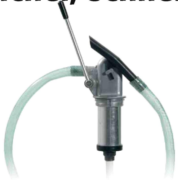
Fasspumpe Zink-Druckguss Bestell-Nr. 19299