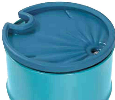
PE-Fasstrichter mit Sieb Bestell-Nr. 2730