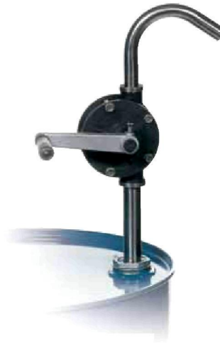
Kurbelrotationspumpe Kunststoff Bestell-Nr. 9519