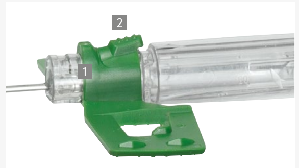
1 Fingerstopper 2 Sicherheitsmechanismus

Venofix® Safety ermöglicht eine einfache Aktivierung des Sicherheitsmechanismus in der Vene. Durch eine Mulde zwischen dem Fingerstopper und dem Sicherheitsmechanismus wird der Zeigefinger in Position gehalten. Leichter Druck auf den Knopf des Sicherheitsmechanismus genügt, um das transparente Gehäuse mit Daumen und Mittelfinger zurückzuziehen und die Kanüle zu sichern.