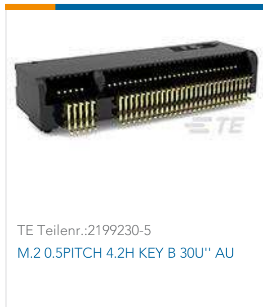
TE Teilnr.:2199230-5 M.2 0.5PITCH 4.2H KEY B 30U" AU