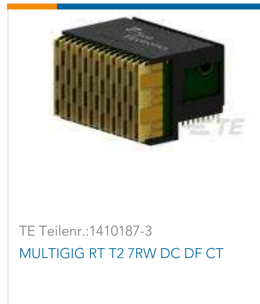
TE Teilnr.:1410187-3 MULTIGIG RT T2 7RW DC DF CT