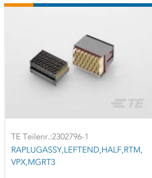
TE Teilnr.:2302796-1 RAPLUGASSY,LEFTEND,HALF,RTM, VPX,MGRT3