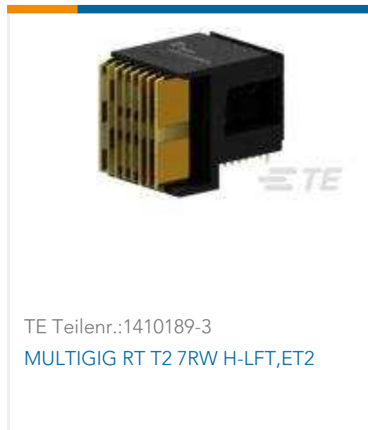
TE Teilnr.:1410189-3 MULTIGIG RT T2 7RW H-LFT,ET2