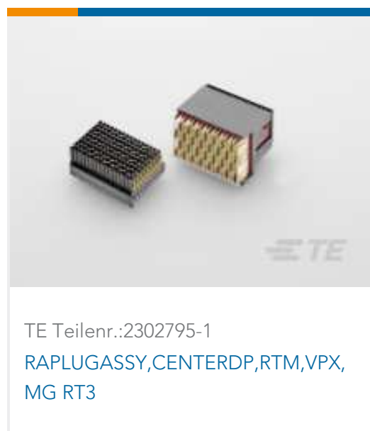
TE Teilnr.:2302795-1 RAPLUGASSY,CENTERDP,RTM,VPX, MG RT3