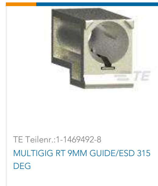
TE Teilnr.:1-1469492-8 MULTIGIG RT 9MM GUIDE/ESD 315 DEG