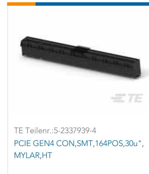
TE Teilnr.:5-2337939-4 PCIE GEN4 CON,SMT,164POS,30u", MYLAR,HT