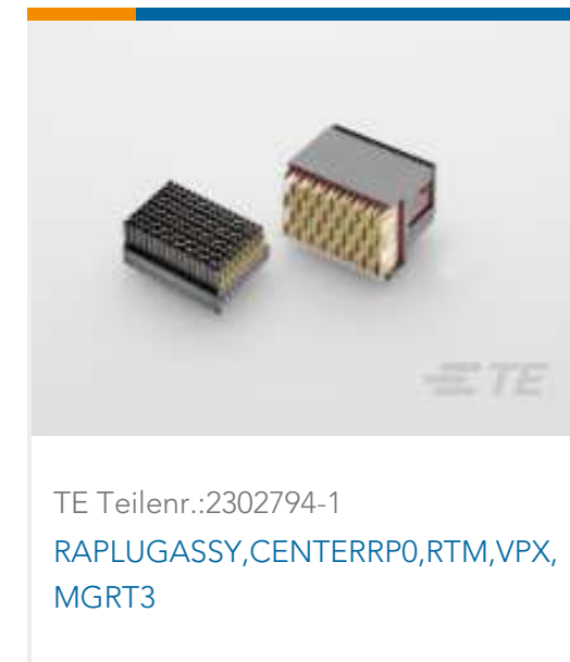
TE Teilnr.:2302794-1 RAPLUGASSY,CENTERRP0,RTM,VPX, MGRT3