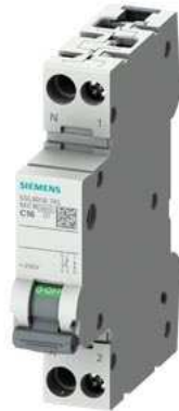
LEITUNGSSCHUTZSCHALTER 230V 6KA, 1+N-POLIG/1TE, N LINKS C16