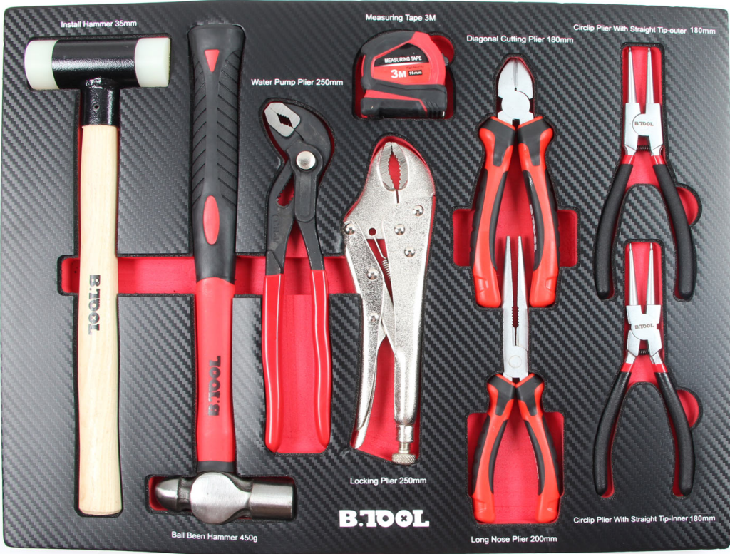
Install Hammer 35mm