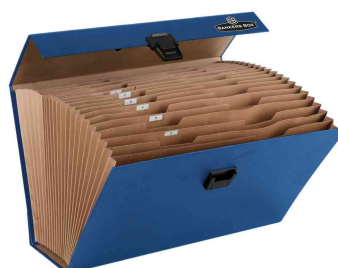
Fächertasche Handifile, offen