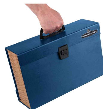
Fächertasche Handifile, mit Tragegriff