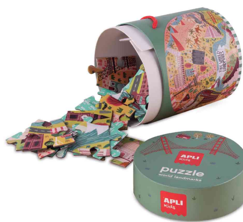
Vue détaillée du contenu