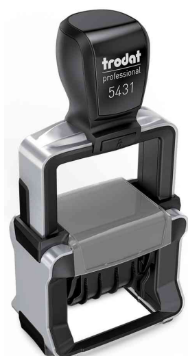
Datumstempel Professional 4.0 5431