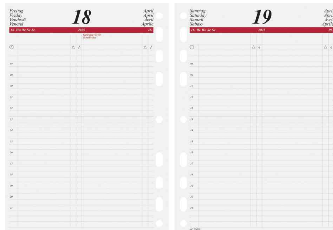
Calendrier pour agenda "Timing 1", journalier