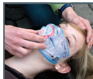
Ambu LifeKey in Verwendung