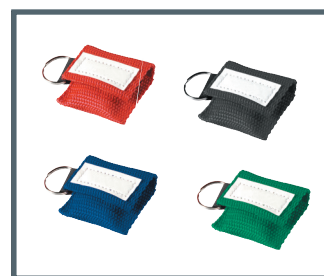
Ambu LifeKey Private Label

Ambu A/S Baltorpbakken 13 DK - 2750 Ballerup Denmark Tel. +45 7225 2000 Fax +45 7225 2053 www.ambu.com