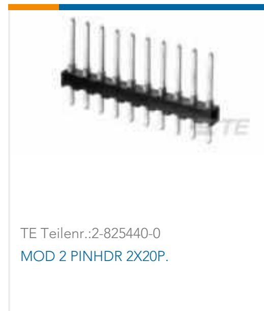
TE Teilnr.:2-825440-0 MOD 2 PINHDR 2X20P.