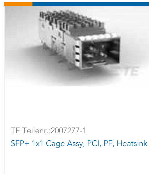
TE Teilnr.:2007277-1 SFP+ 1x1 Cage Assy, PCI, PF, Heatsink