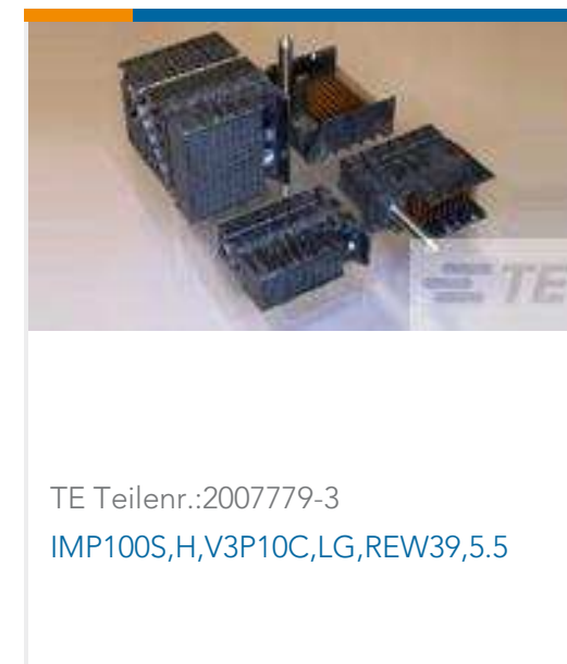
TE Teilnr.:2007779-3 IMP100S,H,V3P10C,LG,REW39,5.5