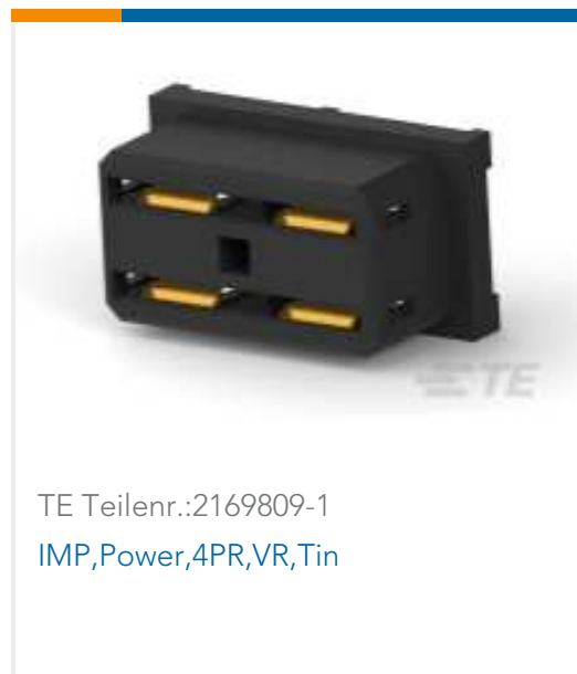
TE Teilnr.:2169809-1 IMP,Power,4PR,VR,Tin