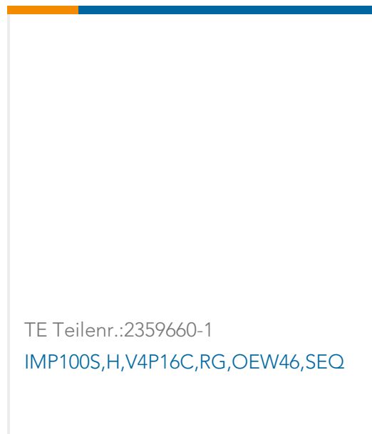
TE Teilnr.:2359660-1 IMP100S,H,V4P16C,RG,OEW46,SEQ