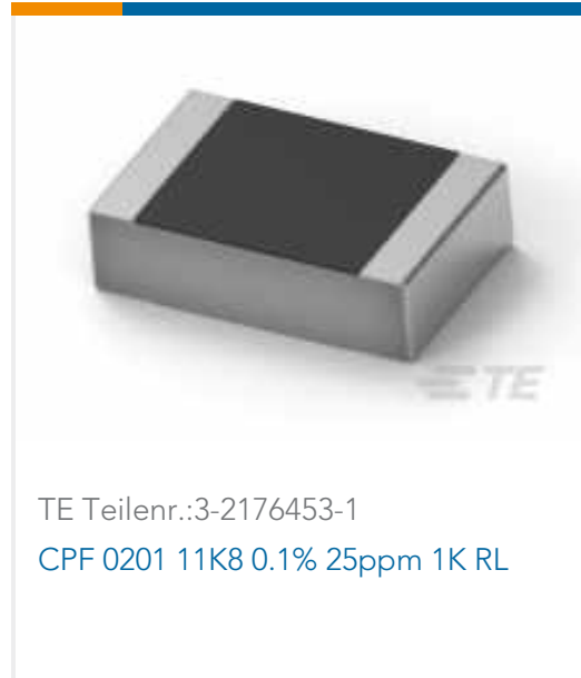
TE Teilnr.:3-2176453-1 CPF 0201 11K8 0.1% 25ppm 1K RL