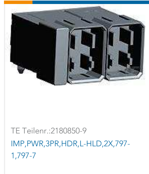
TE Teilnr.:2180850-9 IMP,PWR,3PR,HDR,L-HLD,2X,797-1,797-7