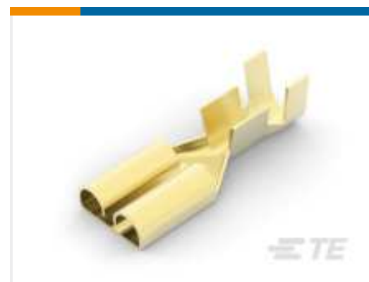
TE Teilnr.: 170258-1 FF 250 REC 14-12AWG BR REREELING