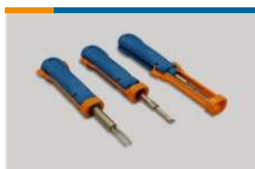
Einsetz- und Entriegelungswerkzeuge (2)