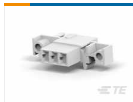
TE Teilnr.: 1-480252-0 FF 187 REC HSG 3P NYLON NAT