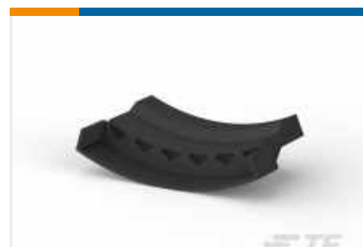
TE Teilnr.: 521381-1 FF 187 REC HSG 6P NYLON BLACK