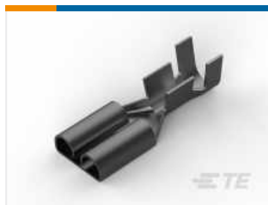
TE Teilnr.: 170258-2 FF 250 REC 14-12AWG TPBR REREELING