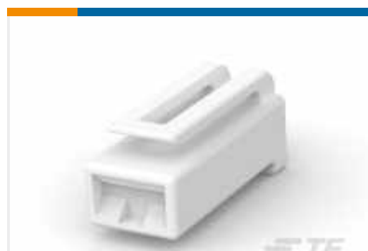
TE Teilnr.: 521743-1 FF 250 HOUSING RECEPTACLE NYLON 6/6