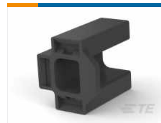
TE Teilnr.: 480100-1 FF 312 REC HSG 3P NYLON BLACK