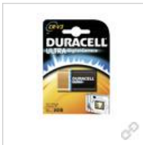
Duracell Ultra Lithium CR-V3 BG1