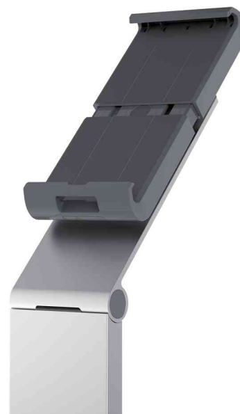
Support sur pied pour tablette "TABLET HOLDER FLOOR", vue détaillée