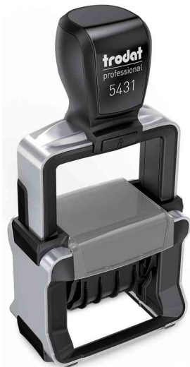
Datumstempel Professional 4.0 5431

Zubehör: Ersatzstempelkissen: Abgabe nur in ganzen VE's