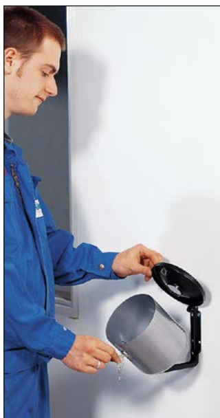
Leichte Entleerung durch Kippmechanismus (180° schwenkbar)