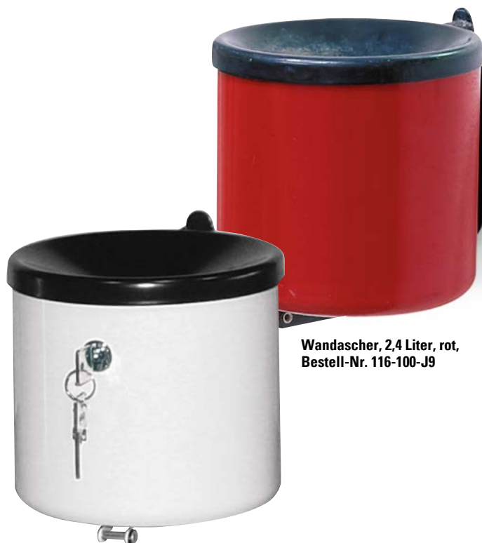
Wandascher, 2,4 Liter, rot, Bestell-Nr. 116-100-J9