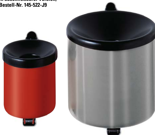
Wandascher, 0,6 und 2,4 Liter