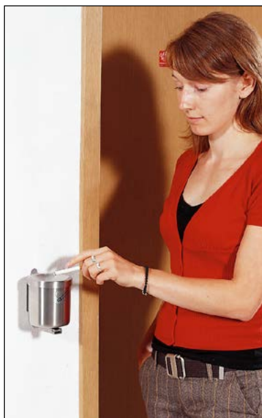
Wandascher aus Edelstahl