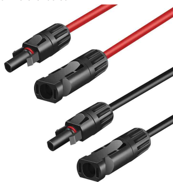
Visuel de référence : set de rallonges pour panneau solaire