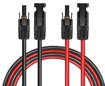
Visuel de référence : set de rallonges pour panneau solaire