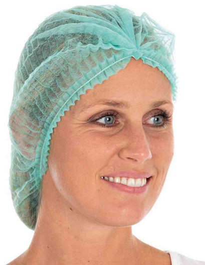
Visuel de référence : charlotte à clipser PP Light, vert