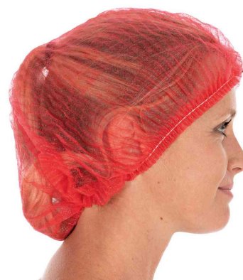
Visuel de référence : charlotte à clipser PP Light, rouge