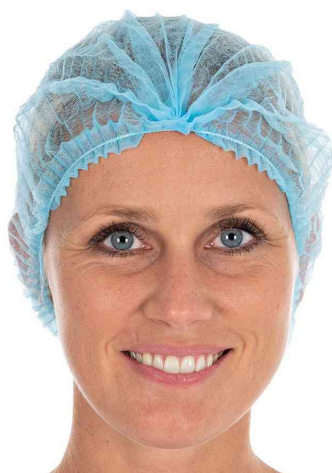
Visuel de référence : charlotte à clipser PP Light, bleu