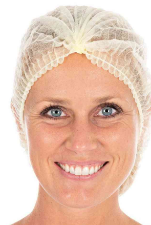
Visuel de référence : charlotte à clipser PP Light, jaune