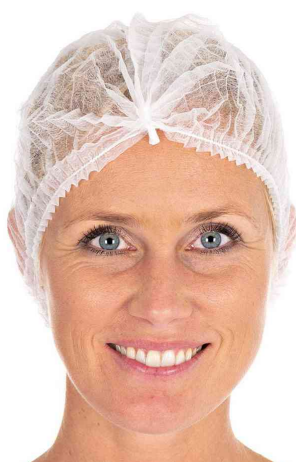
Visuel de référence : charlotte à clipser PP Light, blanc