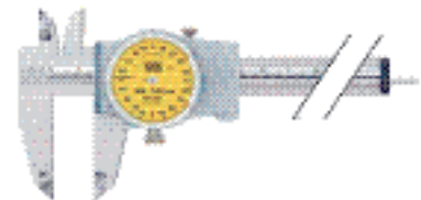
R.sz. 31169 Kód 020