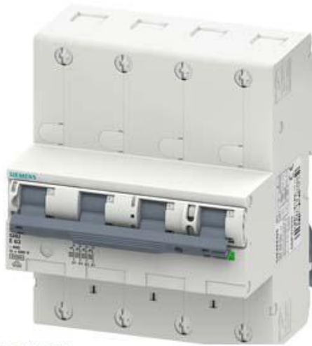
HAUPTLEITUNGSSCHUTZSCHALTER (SHU), 4POLIG, E 63, 400V