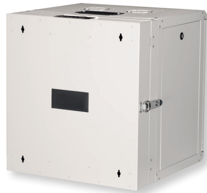
Rückwand mit Kabelzuführung