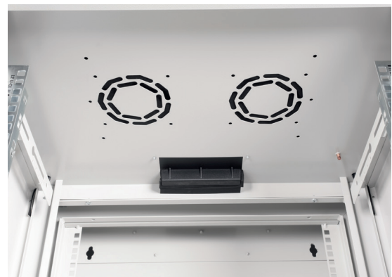
Dach mit Ausstanzungen für Belüftung