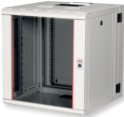
Fronttür aus gehärtetem Glas