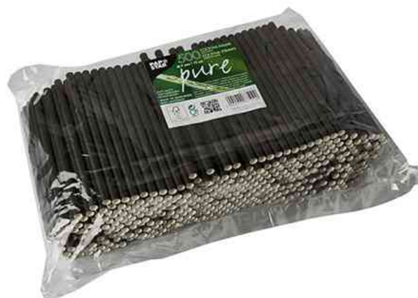
Paille en papier "pure", conditionnement