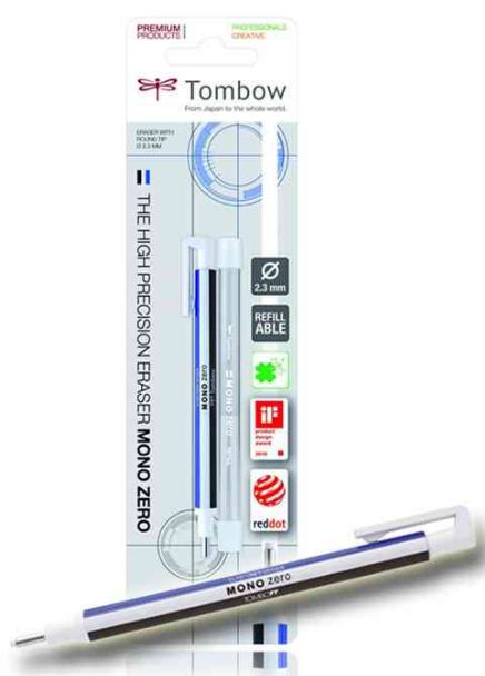
Stylo-gomme "MONO ZERO", pointe ogive, carte blister