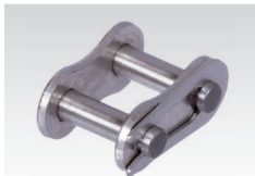
Nr. 11/E: Steckglied mit Federverschluss