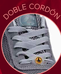
Energy Gravity 85800-3 Gris-Azul