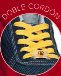
Energy Gravity 85800-4 Marino