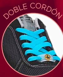
Energy Gravity 85800-1 Negro