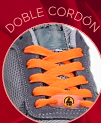
Energy Gravity 85800-2 Gris