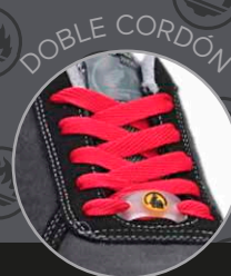
Energy Ionic 85801-1 Negro