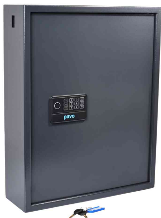
Armoire à clés Haute Sécurité pour 100 clés