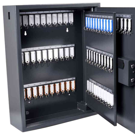
Armoire à clés Haute Sécurité pour 100 clés, ouvert