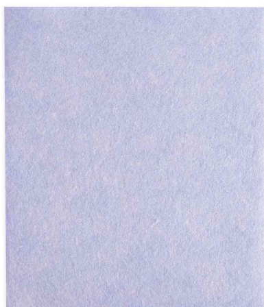
Chiffon multi-usage Tetra Light, bleu