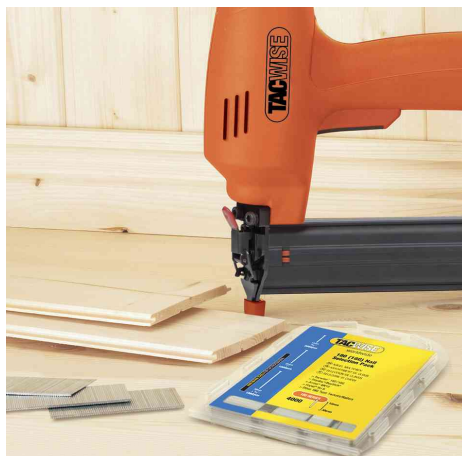
Visuel de référence : montre le produit en utilisation