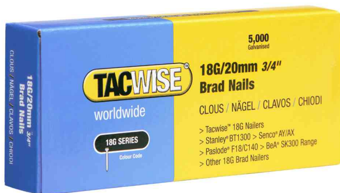
Visuel de référence : clous pour cloueuse pneumatique type 18G