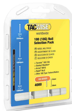
Visuel de référence : montre l'emballage du multipack (65900110)