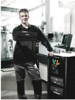
Wera 2go 3 – Der Drinpacker