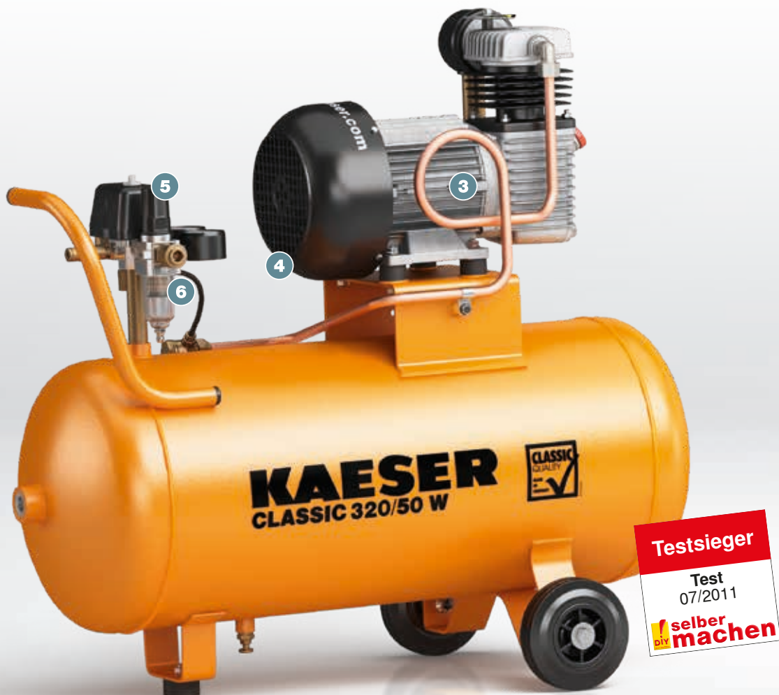
Abb.: CLASSIC 320/50 W