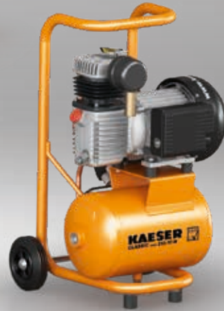
Abb.: CLASSIC mini 210/10 W