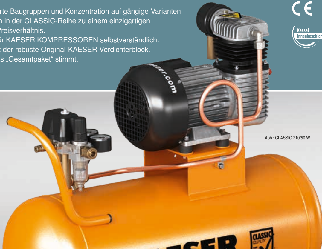
Abb.: CLASSIC 210/50 W