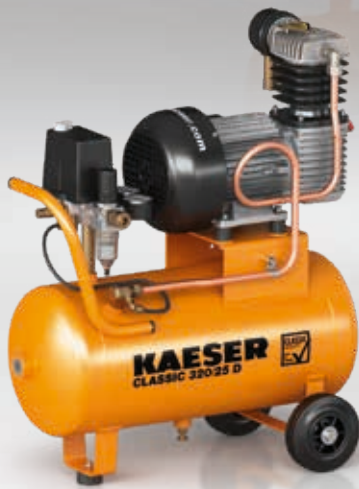
Abb.: CLASSIC 320/25 D