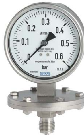
Plattenfedermanometer Typ 432.50

Gehäuse und messstoffberührte Teile aus CrNi-Stahl erfüllen hohe Beständigkeitsanforderungen gegenüber aggressiven Messstoffen. Für besonders hohe Beständigkeitsanforderungen kann der Druckraum optional mit einer großen Vielfalt an Sonderwerkstoffen wie z. B. PTFE, Tantal oder Hastelloy ausgeführt werden.