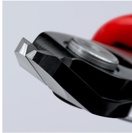
Scherschnitt mit kontrolliertem Micro-Schneidkantenversatz für lange Lebensdauer und ultrapräzisen Schnitt auch dünner Drähte