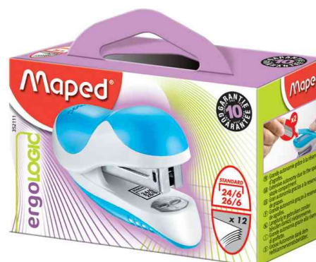
Agrafeuse Ergologic Mini, dans un carton