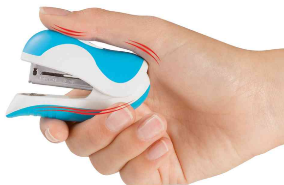
Visuel de référence: présente le produit en utilisation