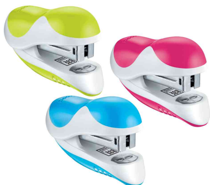
Agrafeuse Ergologic Mini